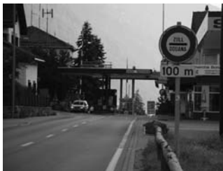
Von einigen nicht bemerkt: Zollpassage ins Val Mustair