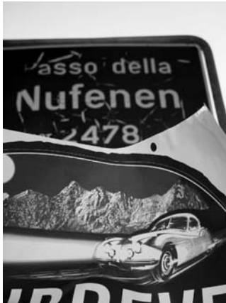
Überquerte Pässe: Nufenen...