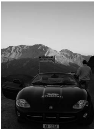
...und dello Stelvio

Beiden waren wohl am Kaffee-Doping. Dann ging's weiter zum Lukmanier. Leider etwas zu rasig, so dass das Foto rückwärts mit René Felder's schönem dunkelblauen E-Typ-Cabriolet zentral vor der Frontansicht des Klosters Disentis, völlig unscharf und verwackelt, schlicht unbrauchbar wurde.