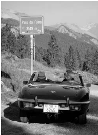
... del Fuorn...