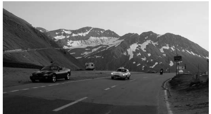
Balz Bessenich auf der Furka-Passhöhe