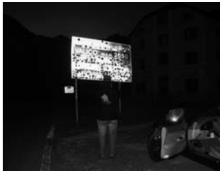
...zum Passo di Gavia...