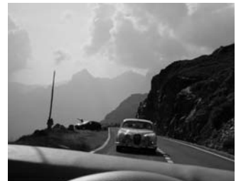
...und weiter zum nächsten Pass