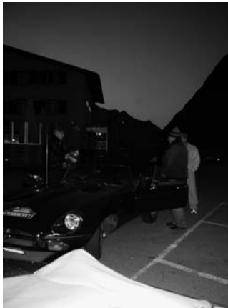
Die «Fliegerbekleidung» wird montiert