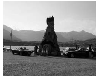
Halt auf dem Gotthard...