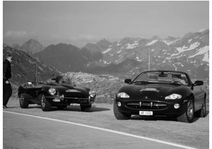
Kurzer Halt mit Blick auf herrliches Bergpanorama

Wir waren, mit René im Gefolge, inzwischen auf der Bernardinopasshöhe angekommen und genossen da die herrliche Vollmond-Atmosphäre. Wir konnten uns kaum satt sehen an der sich im ruhigen See spiegelnden grossen Mondscheibe über der Bergkette. Über den See schien sich gegen uns eine Strasse aus flüssigem Silber langsam im Wasser zu verlieren. Die am Seerand liegenden kleinen Boote lockten sehr, aber für einen Ausflug auf diesen Märchensee fehlte selbst uns die Zeit.