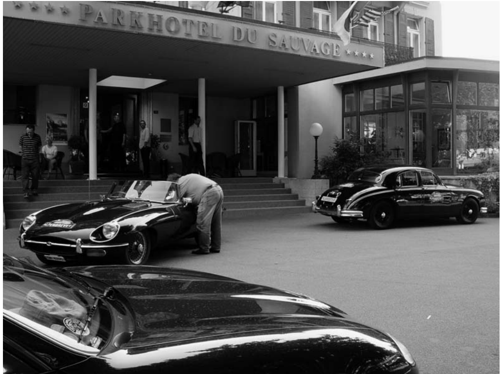
Treffpunkt: Parkhotel du Sauvage in Meiringen

Nach unserem Start so um 17:30 Uhr, gerieten wir bei der Überquerung des Sustens hinter einen doppelzügigen Holztransporter, welcher sich wohl verfahren hatte. Jedenfalls blieb er plötzlich mit Warnblinkanlage ganz verloren stehen, so dass wir ihn nur mit sehr viel Mühe passieren konnten. Dafür war die Walliser Abfahrt des Nufenen ein Erlebnis besonderer Art: In der warmen Abendsonne sassen Murmeltiere(!) ganz friedlich am Strassenrand und beobachteten offensichtlich interessiert und fasziniert den Verkehr. Selbst ein nahe bei ihnen stoppendes Auto brachte sie nicht im geringsten aus der Ruhe, erst ein Autofahrer, welcher sich die niedlichen Tiere zu Fuss beäugeln wollte, trieb sie