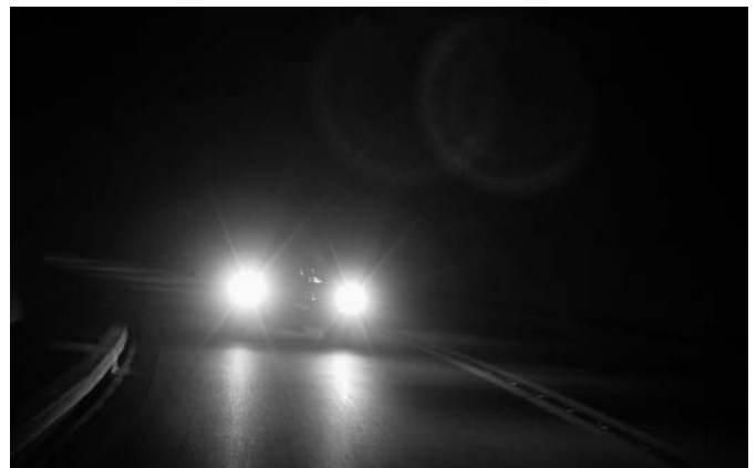
E-Type auf nächtlicher Strasse