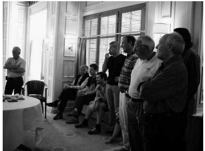
Warten auf die wohlverdiente Alpenbrevet-Trophäe