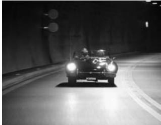
... durch beleuchtetes Tunnel...