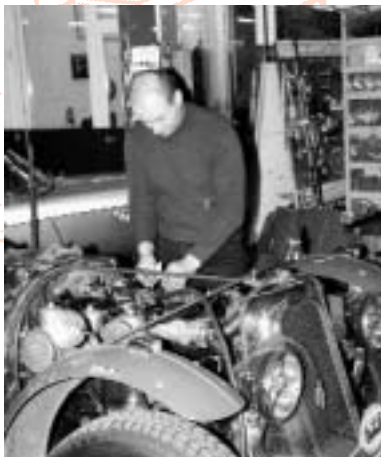
GB Dönni beim Ausbau des Motors

den Seealpen fertig fahren. Auch musste der arme Motor eineinhalb Stunden mit geschlossenem Ther-