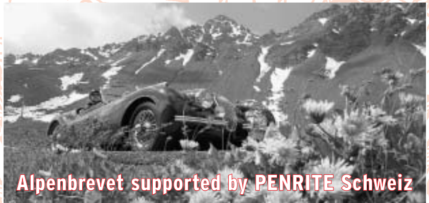
Alpenbrevet supported by PENRITE Schweiz

durchgeführt. Einerseits wird die Palette nach oben und unten abgerundet, andererseits werden die Verpackungen benutzerfreundlicher gestaltet. In der Schweiz werden dagegen keine grossen Änderungen geplant, denn es besteht kein Grund dazu. Beim pro Kopf Verbrauch von Penrite Öl in Europa liegt nämlich die Schweiz mit Abstand an der Spitze! Dies ist auch kaum überraschend, schätzt der Schweizer doch in der Regel gute Qualität und ist nach positiver Erfahrung ein sehr treuer Kunde. Dieser Erfolg ist aber nicht nur dem Produkt, sondern auch der hervorragenden Aufklärungsarbeit der Penrite Stützpunkte zu verdanken. Am Ende ist unser Erfolg aber jedem einzelnen Oldtimerfahrer zu danken, der Penrite anwendet und weiterempfiehlt. Für ganz «angefressene» haben sich die zwei Klassikrally Enthusiasten Balthasar Bessenich und Georg Dönni eine ganz besonders harte Prüfung für die Vollmondnacht vom 13. Juli 2003 ausgedacht: Bis zum Morgengrauen so viele Alpenpässe wie möglich zu überqueren. Mehr unter «Alpenbrevet». Happy motoring und viele gut geschmierte Stunden mit Ihrem Klassiker wünscht Ihnen Ihr Penrite Schweiz Team.